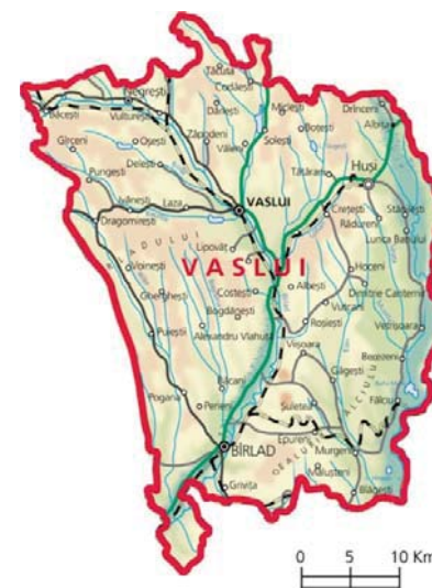
Figura nr. 2 - Județul Vaslui