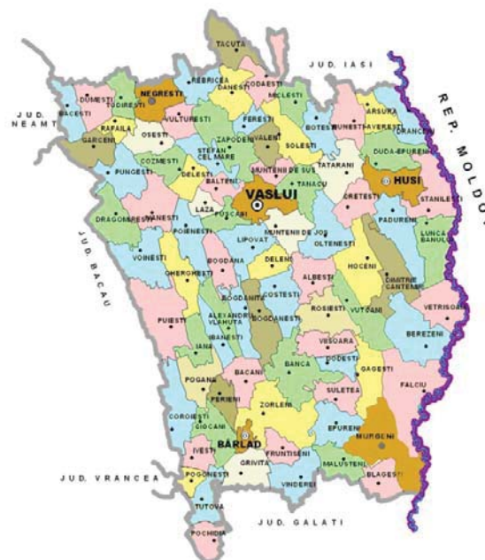
Figura nr. 3 – Organizarea administrativ-teritorială a județului Vaslui

Ponderea populației urbane la nivel regional și județean a înregistrat în intervalul de timp 2002-2010, o descreștere de la 44,03% la 40,59%, datorată migrației ce a avut loc spre zona rurală, efect al procesului de restructurare industrială din această perioadă. Această tendință s-a manifestat și în perioada 2006-2008, astfel încât la 1 iulie 2004 ponderea populației urbane a ajuns 41,33% față de 42,6% în 2001.