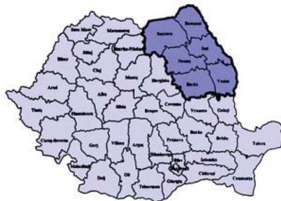
Figura nr. 1 - Regiunea de Dezvoltare Nord-Est

Județul Vaslui este situat în partea de Est a României, pe cursul mijlociu al râului Bârlad, în regiunea de dezvoltare Nord-Est. Cu o bogată tradiție istorică, culturală, și spirituală, regiunea îmbină în dezvoltare trecutul cu prezentul, tradiția și modernul în valorificarea tuturor resurselor.