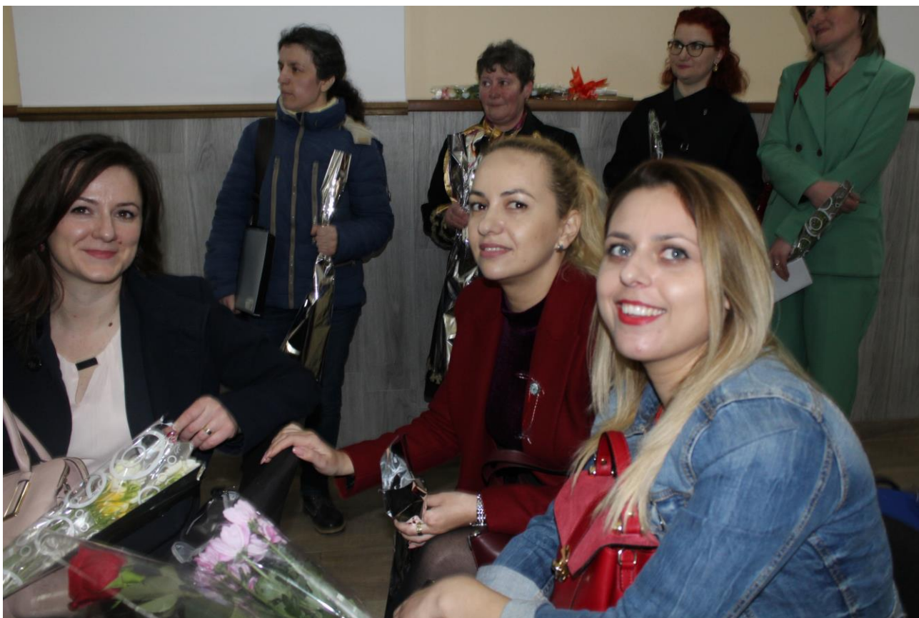
Activitate dedicată Zilei de 8 Martie