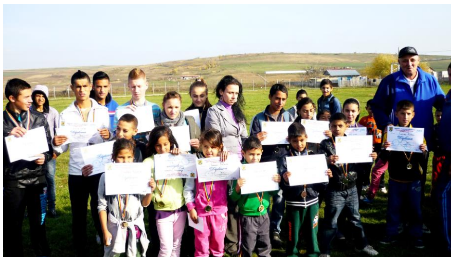
Crosul Bobocilor (în colaborare cu Direcția Județeană de Tineret și Sport Vaslui)